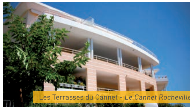
Les Terrasses du Cannet - Le Cannet Rocheville