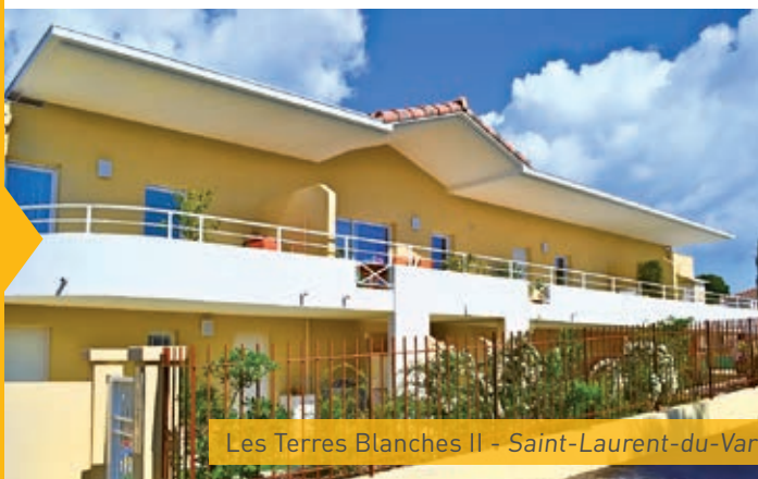
Les Terres Blanches II - Saint-Laurent-du-Var