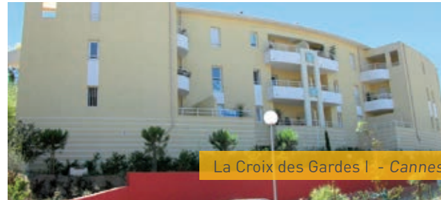
La Croix des Gardes I - Cannes