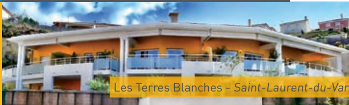
Les Terres Blanches - Saint-Laurent-du-Var

QUELQUES UNES DE NOS RÉALISATIONS DANS LES ALPES-MARITIMES